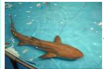
真下にこんなサメが！