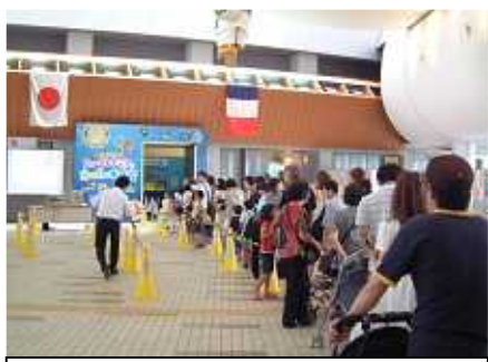
行列が出来るほどの大盛況

世間は夏休み中。混雑を考慮 し、小グループで8月10日、11日 の2階に分けて出かけました。